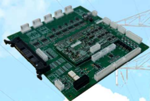
制御装置 (ポニー電機製)